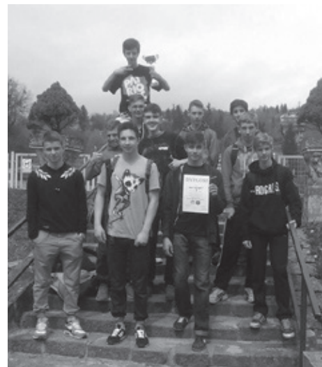
...jak i uczniowie wystąpią w zawodach rejonowych.