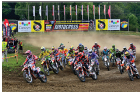
Na pierwszy ogień poszli najmłodszy riderzy.

Już po raz drugi na cieszyńskim torze motocrossowym wystartowali zawodnicy rywalizujący w Mistrzostwach Europy. Wśród kilkudziesięciu riderów znaleźli się reprezentanci Czech, Słowacji, Rosji, Ukrainy, Białorusi, Estonii, Łotwy, Litwy, Chorwacji, Słowenii i Polski. Rywalizowano w trzech klasach: 65cc, 85cc i Open. Nasi zawodnicy startujący w dwóch pierwszych klasach rozegrali także rundę w ramach Mistrzostw Polski.