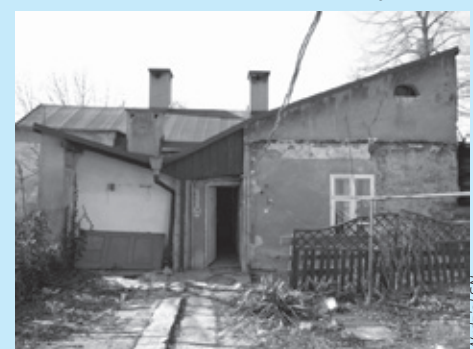
Nieruchomość na sprzedaż przy ul. Głębokiej.