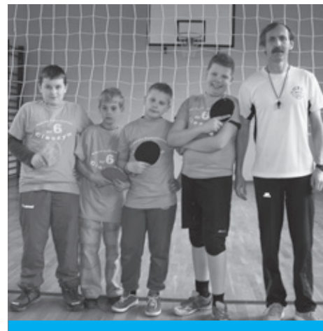
Na razie zajęli miejsce poza podium, ale za rok...