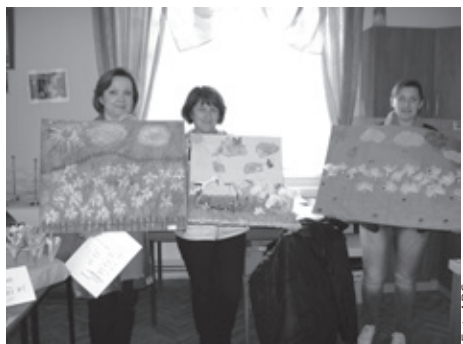
Głównym motywem prac były żonkile.