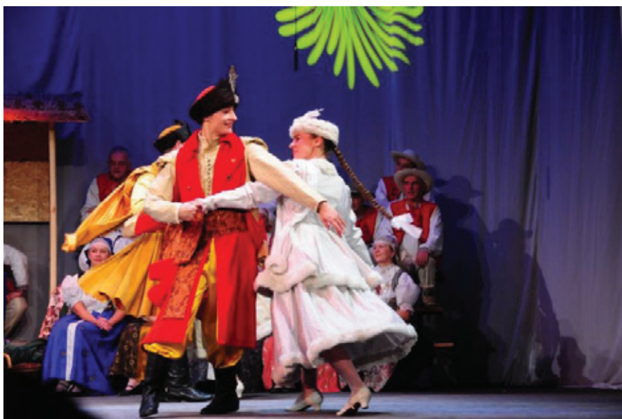
Pierwszy rok dla adeptów w Zespole bywa bardzo pracowity.