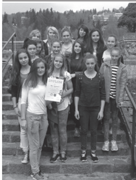
Zarówno uczennice Gimnazjum nr 3...

Drużyny dziewcząt i chłopców z Gimnazjum nr 3 z Oddziałami Integracyjnymi w Cieszynie odniosły bardzo duży sukces w drużynowych zawodach lekkoatletycznych na szczeblu powiatowym. Zawody odbyły się 4 maja w Wiśle. W rywalizacji wzięło udział 10 drużyn dziewcząt i 9 drużyn chłopców.