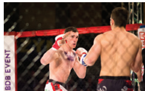
Kibice na pewno nie mogli się nudzić.