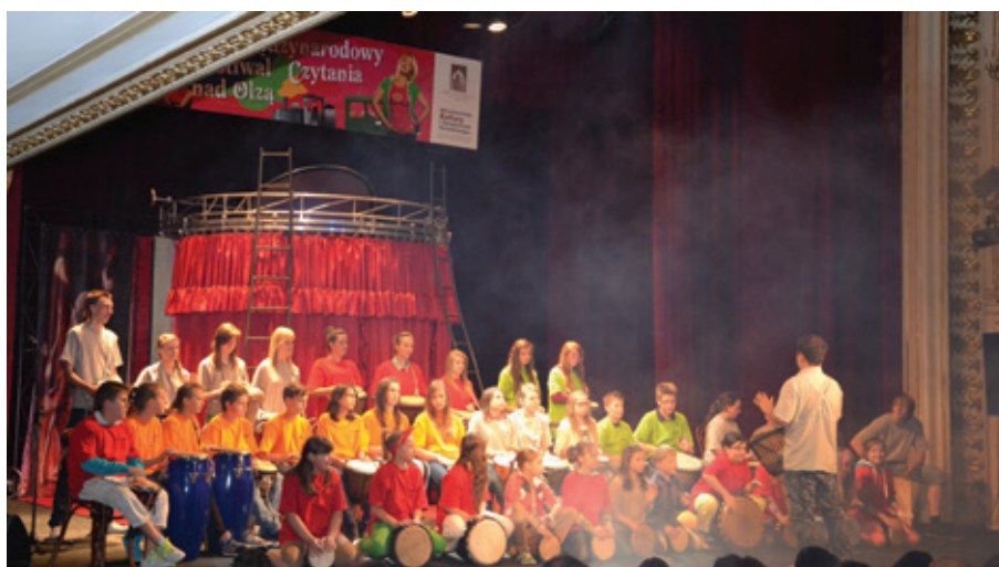
Festiwal zostanie zainaugurowany na deskach Teatru im. Adama Mickiewicza w Cieszynie.