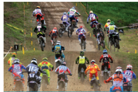
Największe zainteresowanie wzbudzała klasa Open.