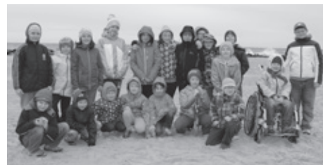
Zespół Promocji SP3

Przygotowania do naszej zielonej szkoły trwały prawie pół roku... Cała klasa dzielnie wytrwała do 4 maja, dźwigając na plecach bagaż nowych i pozytywnych wspomnień. Dziś wszyscy żałują, że ten cudowny tydzień już minął. Ale wrażenia zostaną, a to najważniejsze!