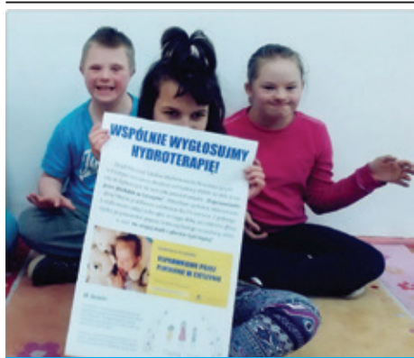
Każdy głos jest ważny, aby pomóc dzieciom.

7 maja w serwisie Aviva. To dla mnie ważne , wystartowała cieszyńska inicjatywa „Usprawnianie przez pluskanie w Cieszynie”, której celem jest zdobycie dofinansowania na stworzenie sali do hydroterapii w Zespole Placówek Szkolno-Wychowawczo-Rewalidacyjnych. Po prawie dwóch tygodniach akcję poparło prawie 4 tys. internautów. Dzięki temu cieszyński projekt ma szansę na realizację! Inicjatorem akcji jest Stowarzyszenie na Rzecz Harmonijnego Rozwoju Dzieci i Młodzieży Nasze Dzieci , które swoją działalnością wspiera przede wszystkim dzieci i młodzież z Zespołu Placówek Szkolno-Wychowawczo-Rewalidacyjnych (ZPSWR) w Cieszynie.